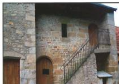
L'ancien manoir de la Braise en cours de rénovation.