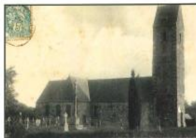
L'église Saint-Pierre.

Hydrographie • La Guérinette - le Saint-Louis - La Champagne • La Braise • Ruisseau du Pas du Gué.