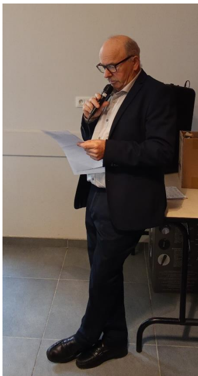
Le discours de bienvenue du maire