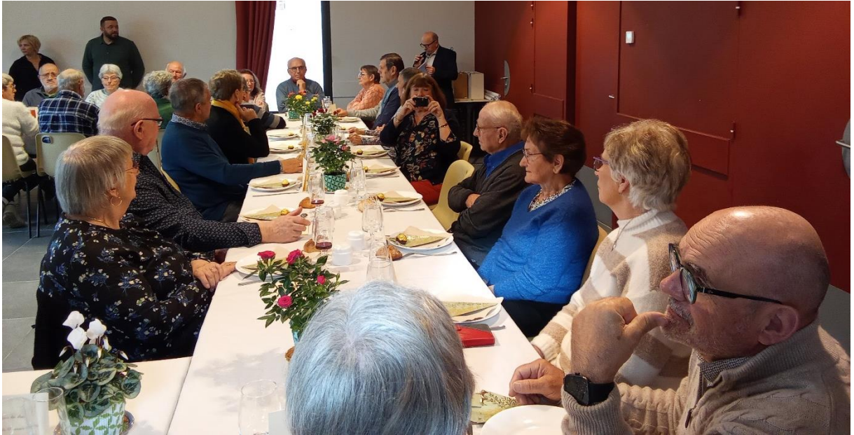
La table des doyens